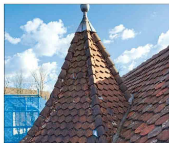
Ein Blick auf das sanierte Dach über der Kanzel