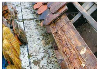
Das Traufenholz am Dach wird ersetzt