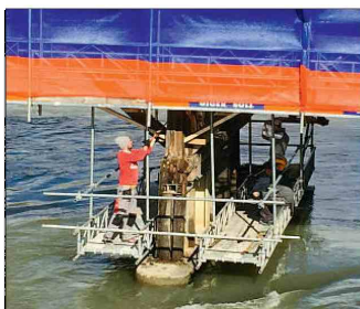
Auch um die Pfeiler herum wird das Gerüst montiert