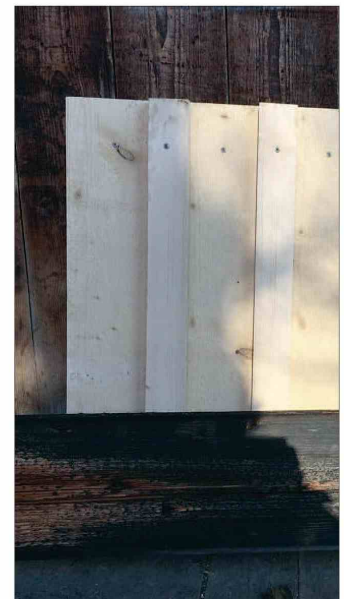
Die Fassade wird anfänglich noch erschreckend hell sein