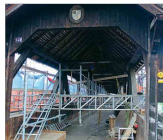
Von der Turgemer Seite – das fachmännische aufgestellte Gerüst