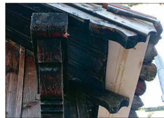
Aus Alt mach Neu. Gut zu erkennen unter dem Dach