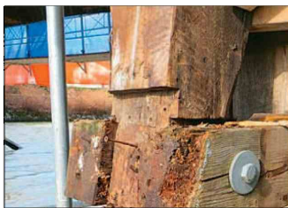
Auch das Holz am Pfeiler ist in keinem guten Zustand