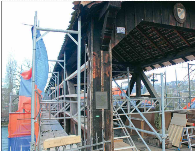
Blick von Turgi. Ersetzte Bohlen und Streben sind bereits montiert und am hellen Holz gut zu erkennen

Auflage 20'237 Ex. Reichweite n. a. Leser Erscheint woe Fläche 65'666 mm 2 Wert 1'700 CHF